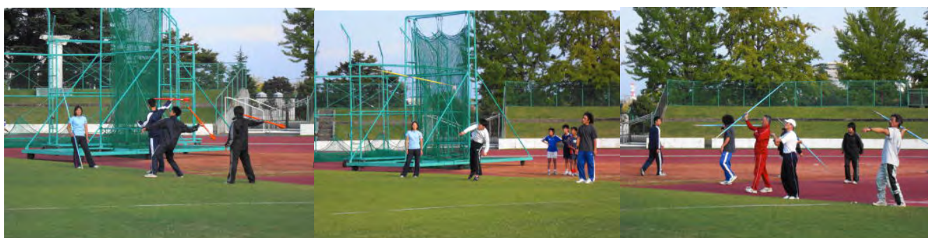
↑ジャベリックスロー