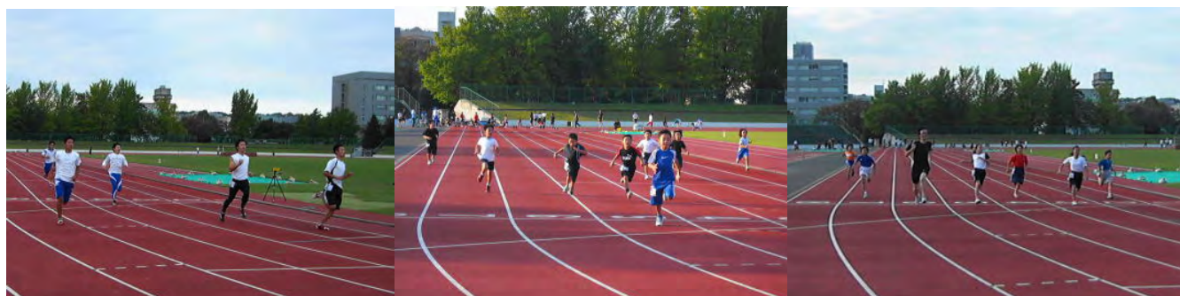
↑100m 走タイムトライアル（電気計測）

タイムトライアル（電気計測）の決勝・計時に万全を期すため、役員「写真判定」技術講習会が実施されました。