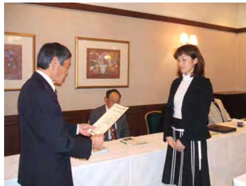
富山マスターズ陸上競技連盟総会での「元気とやまスポーツ賞」伝達式